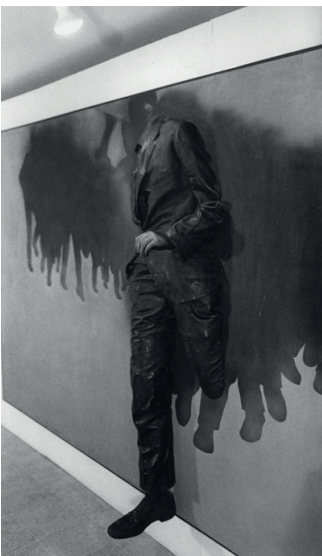
Una obra ganadora de una bienal de arte contemporáneo: La escapada, obra de Rafael Canogar, de España, participante en la III Bienal de Arte de Coltejer.