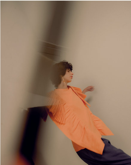
Un diseño ganador de una bienal de diseño: Colección 002 Tierra