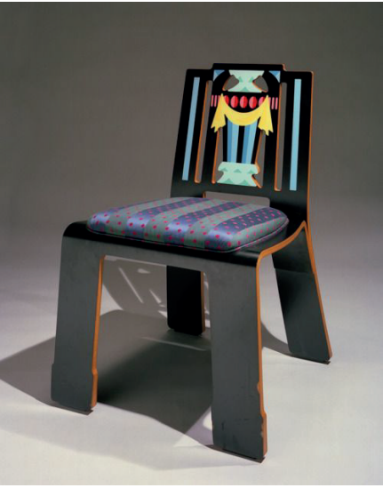
Obra de arte que incluya una pieza de mobiliario: Silla "Sheraton" (modelo no. 664) 1984 Robert Venturi