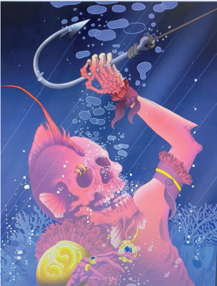
Un diseño con menos de un año de antigüedad: Hector Lemus Diseño | Ilustración Xochimilco, Mexico