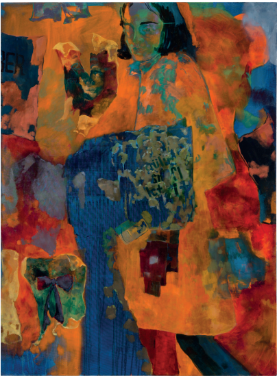
Obra de design art: - Georgia Gardner Gray