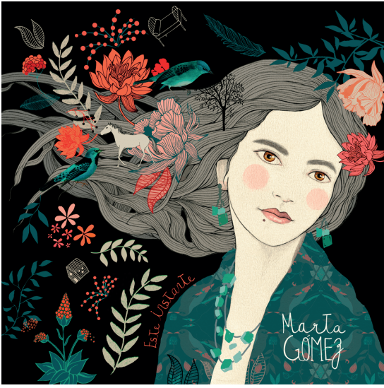
estudio de diseño nacional - Cactus