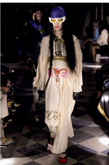
Un diseño de indumentaria: Gucci Resort 2020: el feminismo alto y claro