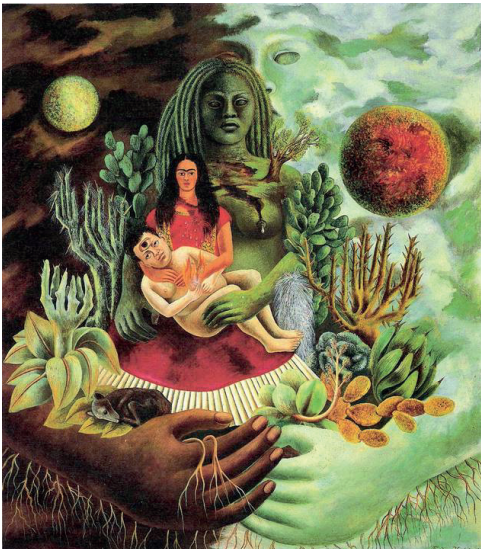
Una obra de arte que te inspire: El abrazo de amor de El universo, la tierra (México), Yo, Diego . Obra de Frida Kahlo